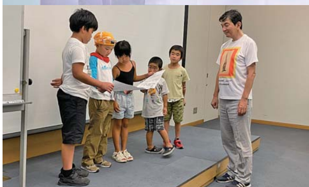
挑戦状を読み上げるハッタミミズ調査隊の活動メンバー（琵琶湖博物館にて）