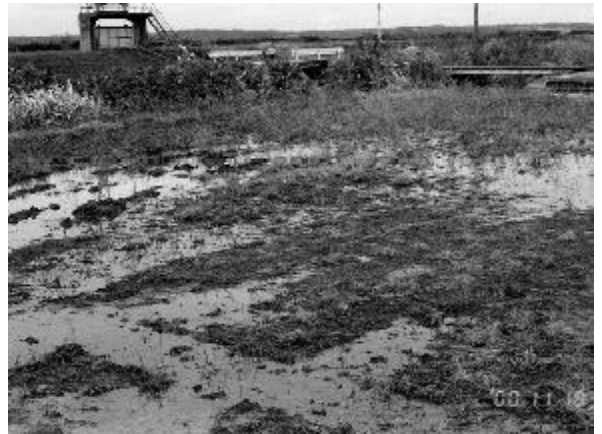
農業用排水路の整備に伴い、アサザの生息場所が消失することから、代替地として整備される予定のビオトープ（建設中）

津幡町川尻地区の東部承水路に沿った農業排水路には、レッドデータブックにも取り上げられている、希少植物の「アサザ」が生育しています。周辺の住宅地化に伴い洪水を防止するため、この排水路を改修する必要が出てきました。水路を改修した場合、アサザの消滅が懸念されます。河北潟の東側には、この水路にしかアサザは残っていません。水路自体が人工的な環境であり、現