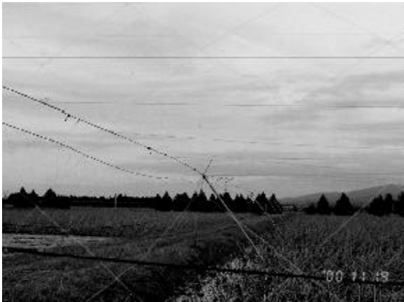
新型のハス田防鳥設備、番線を張ったため野鳥が絡まなくなった

レンコンはカモにかじられると売り物にできないため、被害金額が多くなることで問題が深刻化し、8年前からカモによる食害を防止するための防鳥ネットが設置されています。このネットは野鳥が絡まりやすい構造であったことから、カモ類だけでなく多くのシギ・チドリ類や希少猛禽類などが犠牲になっています。今年本格的に採用されることとなった新型ネットは、ステンレス製の番線でできているため、これまでよりは野鳥の羽が絡まりにくい構造となっているのが特徴です。カモによるレンコンの食害やその対策を巡ってはまだまだ多くの課題を残していますが、生産者を含め野鳥を保護する方向での取り組みがでてきたことは評価できることです。