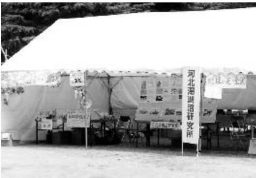
ボランティアフェスタ2000での出展ブース

河北潟湖沼研究所は、この夏おこなわれた2つのイベントに出展しました。「いしかわ・かんきょうフェア2000」は8月19 - 20日に石川県産業展示館2号館にて、「ボランティアフェスタ2000」は8月26日に金沢市中央公園でおこなわれました。河北潟湖沼研究所は県内初の環境NPO法人として、河北潟の環境問題とその解決の方向性についての見解を展示しました。