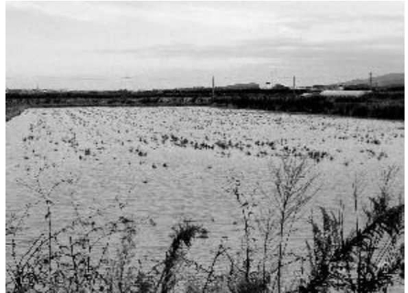
カモによる農作物の食害対策としてつくられた「おとり池」

最近、このおとり池が完成しました。カモたちがこの池を利用してくれることを願いながら、河北潟湖沼研究所もカモたちと農業との共生へ向けてさまざまな取り組みに参加していきたいと思えます。