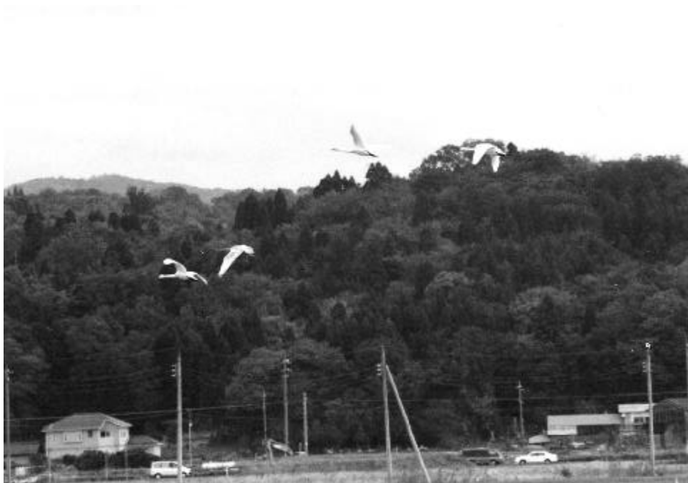
コハクチョウの群れ（津幡町川尻にて、2000年11月）

河北潟の東岸、津幡町川尻から内日角には、毎年多くのコハクチョウが飛来します。今年もまた、群れをつくってやって来ました。翼を休めたり、水田の二番穂をついばんでいるのが観察されます。