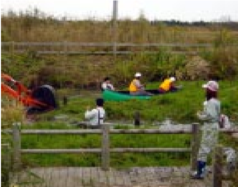
バックホウなどの重機とともに手作業で整備をおこないました。

11月7日に津幡町川尻のアサザビオトープで、アサザの生育場所の保全のための作業がおこなわれました。このビオトープはアサザ保全のために2000年に整備されましたが、その後外来種のチクゴスズメノヒエが繁茂し、アサザの衰退の傾向が顕著となっていました。そこで今回、アサザビオトープの造成に関わった事業者や、石川県津幡農林事務所・津幡町・河北潟沿岸土地改良区の職員、河北潟湖沼研究所の研究員、住民等、約20人がボランティアとして参加