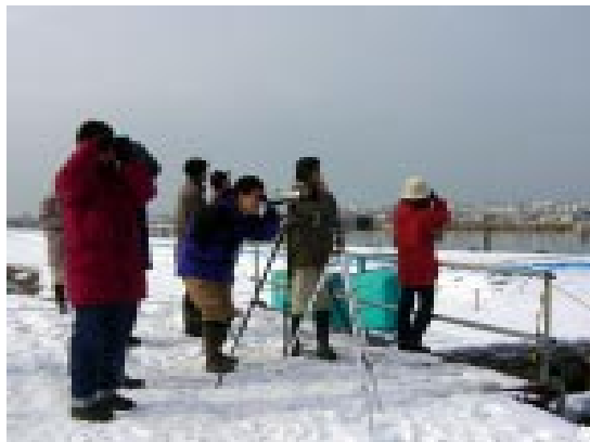
昨年の冬の観察会の様子