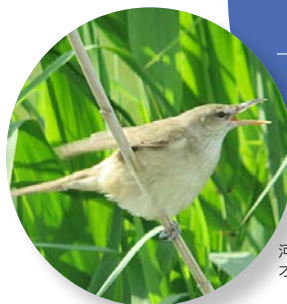
河北潟の オオヨシキリ