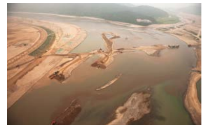
4大河川事業 (韓国・ナクトンガン)